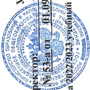
ГРАФИК ОЦЕНОЧНЫХ ПРОЦЕДУР ГБОУ «СОШ № 4 с.п. Пливео имени Плиева М-С.А.» на 2022/2023 учебный год